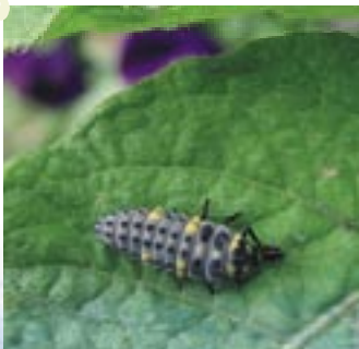
Larve de coccinelle dévorant un puceron

Il est rarement utile d'acheter des auxiliaires. Ils s'installeront naturellement dans le jardin, si vous savez l'aménager et l'entretenir pour les accueillir.