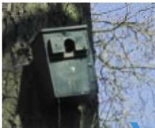
Nichoir à mésange

Les oiseaux comme les mésanges nichent dans les cavités des vieux arbres. Pour les attirer dans le jardin, accrochez un ou deux nichoirs avant mars. Suspendez le à un arbre ou le long d'un mur exposé au sud-est.