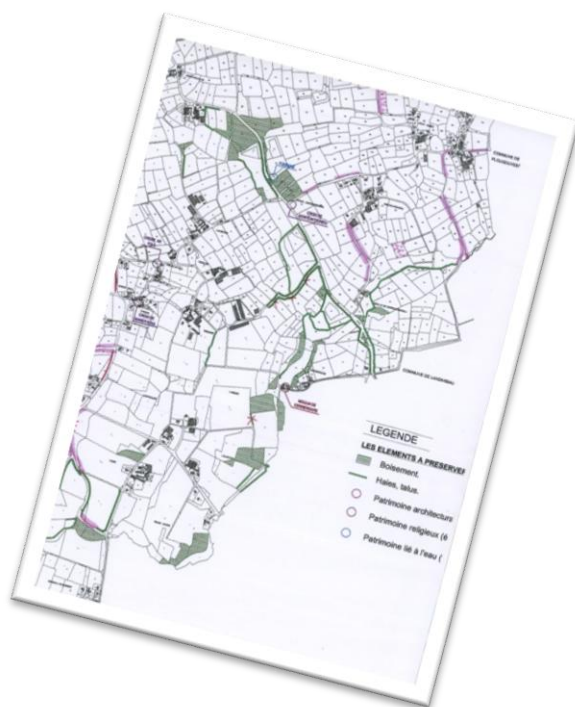
Exemple de PLU

NB: Cette mesure s'applique à la suppression définitive d'éléments bocagers et non à la gestion courante des haies (recépage, balivage...).