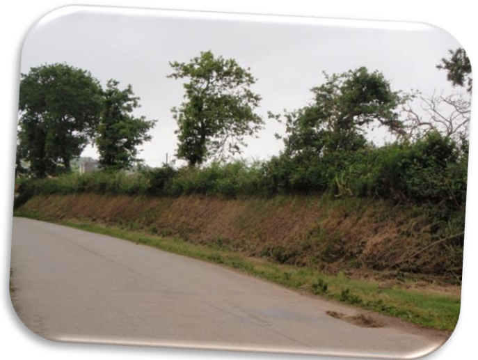
Exemple sur la photo ci-contre : bonne gestion des talus sur la commune d'Irvillac (2012)