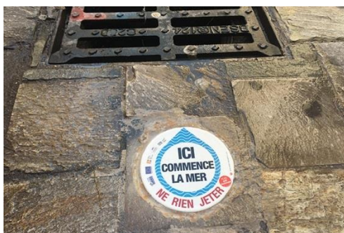
Exemple de macaron à proximité d'un avaloir

Pour sensibiliser le grand public au devenir des déchets jetés dans les avaloirs d'eau pluviale, une quarantaine de macarons « Ici commence la mer, ne rien jeter » seront installés à proximité des avaloirs sur les communes de Landivisiau et Sizun.