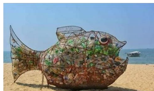
Exemple de sculpture