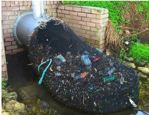
Exemple de filets de rétention