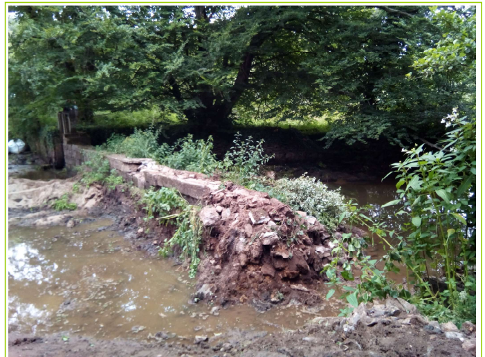
déversoir en cours de destruction