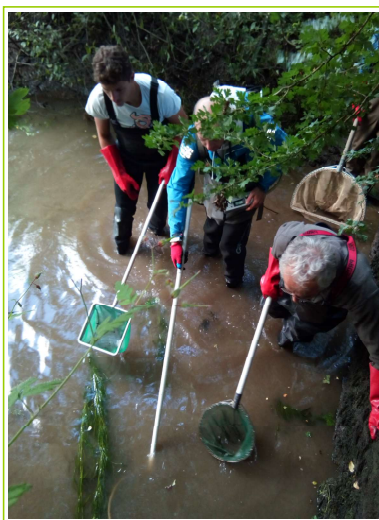
pêche de sauvegarde dans le bief