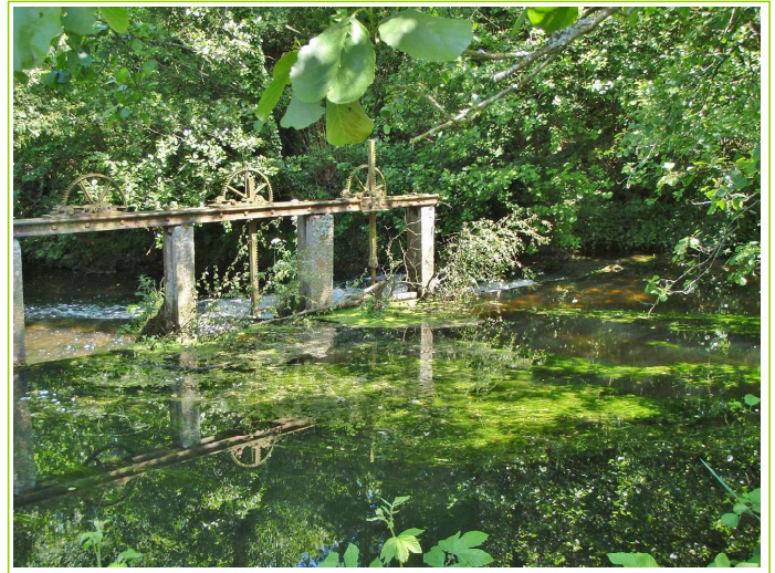
vannage aval avant travaux