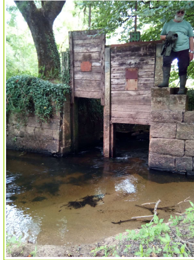
vannage avant travaux