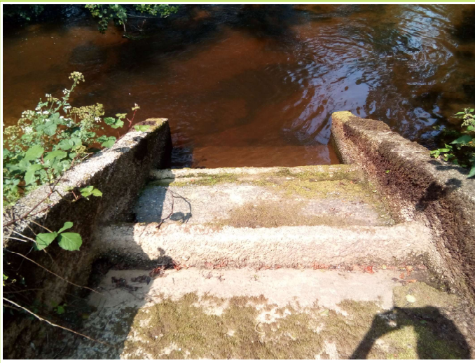
passe à poissons avant travaux