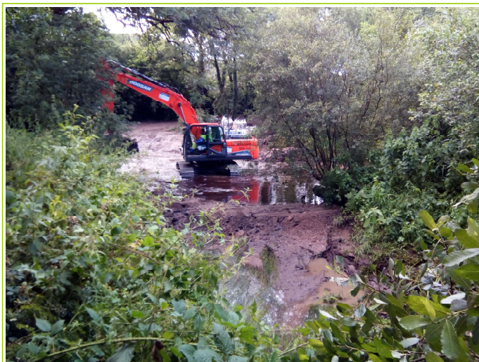
fin de travaux : comblement de l'entrée du bief