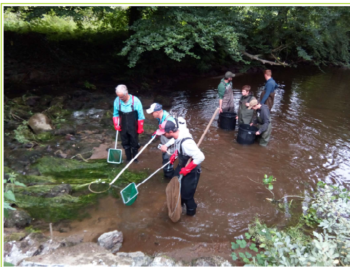
pêche de sauvegarde dans l'Elorn