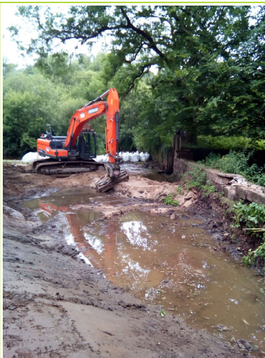
mise à sec de la zone de travaux