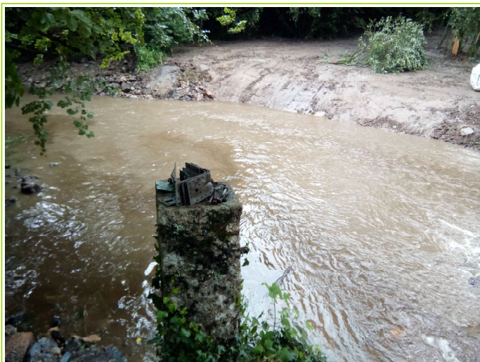
rivière après travaux