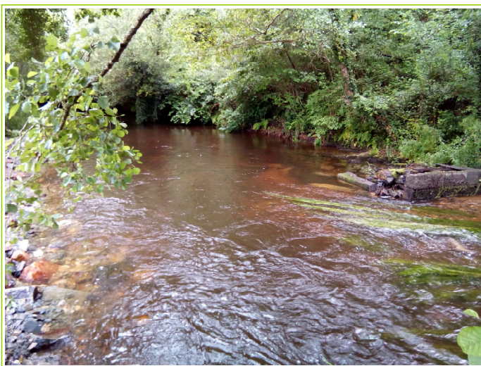
vannage aval supprimé