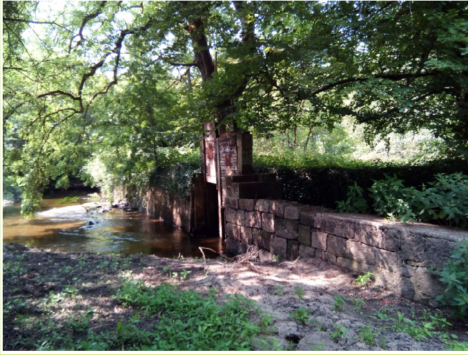
déversoir + vannage avant travaux